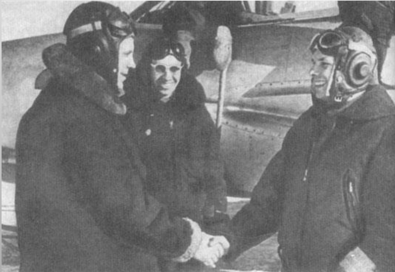
Ю.А. Гагарин принимает поздравления от своих товарищей после успешного полета на самолете. Мурманская обл. 1958 г.