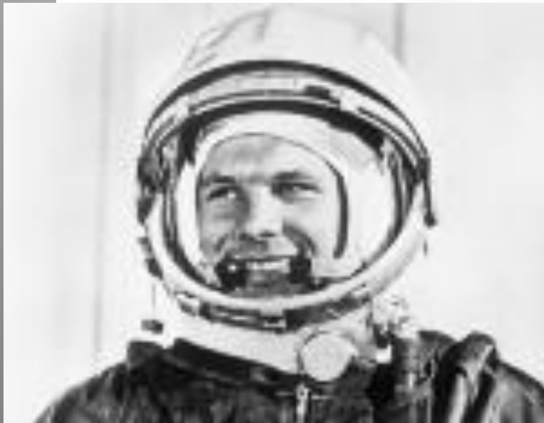
Исторические слова Юрия Гагарина

Облетев Землю в корабле-спутнике, я увидел, как прекрасна наша планета. Люди, будем хранить и приумно- жать эту красоту, а не разру- шать её! Гагарин -