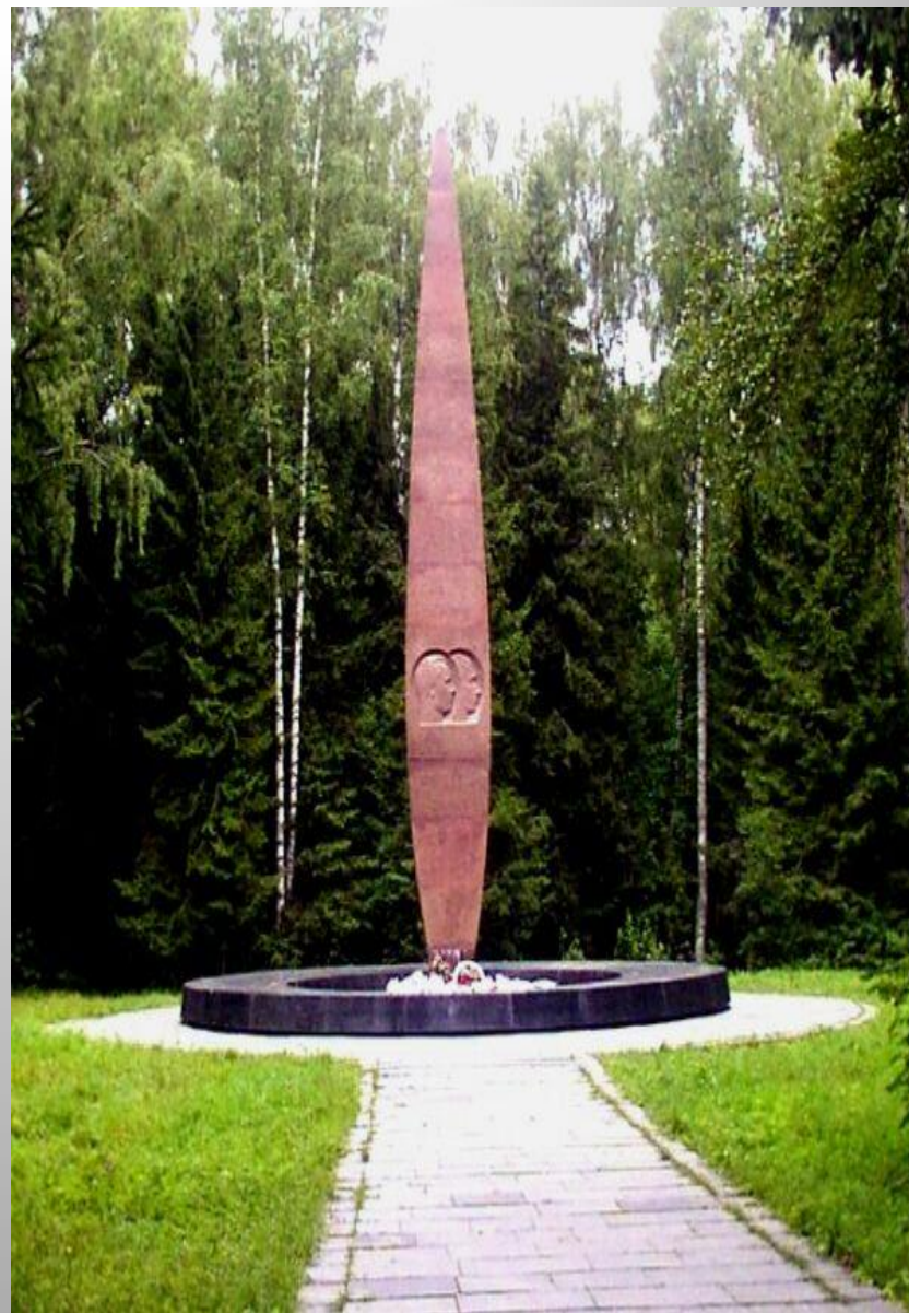
Обелиск на месте гибели лётчиков

27 марта 1968 погиб в авиакатастрофе на самолете УТИ МиГ-15 вместе с летчиком-испытателем, полковником В.С.Серегиным во время тренировочного полета.