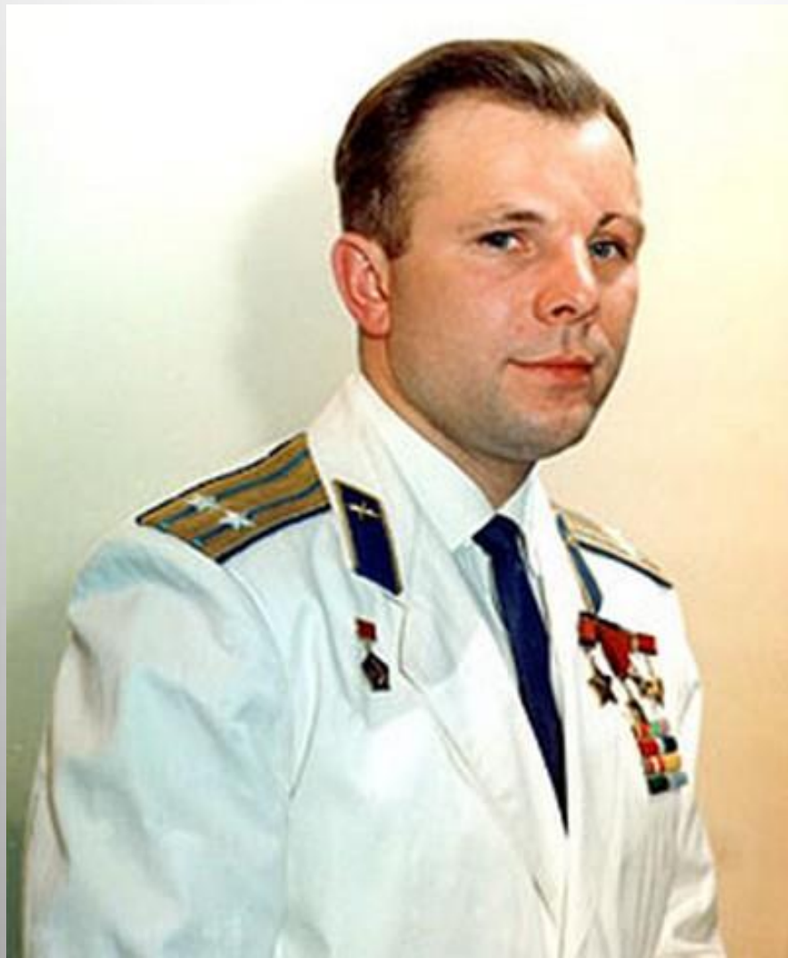
Юрий Алексеевич Гагарин – первый космонавт