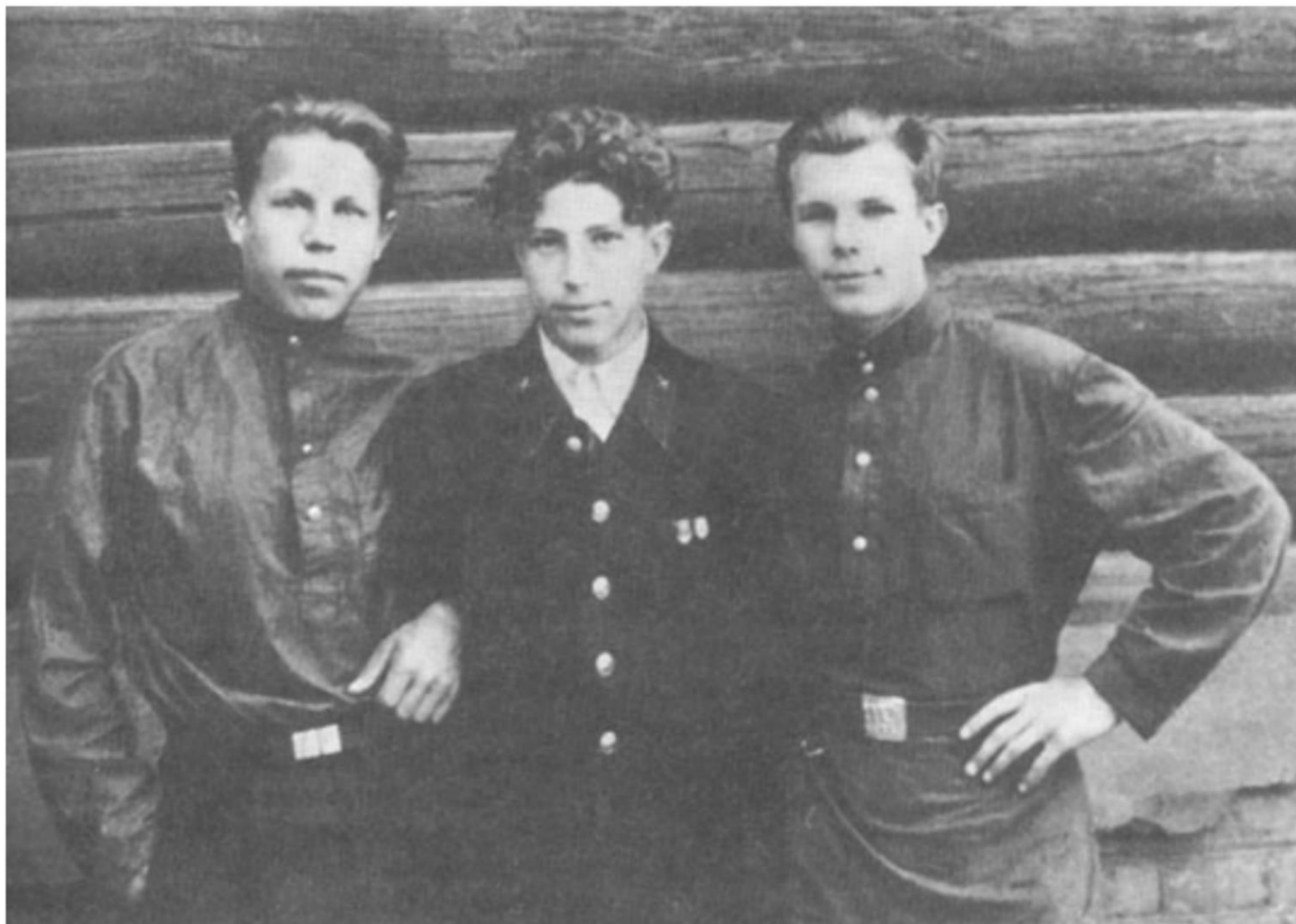
Юрий Гагарин со своими друзьями по ремесленному училищу. Люберцы. 1951 г.